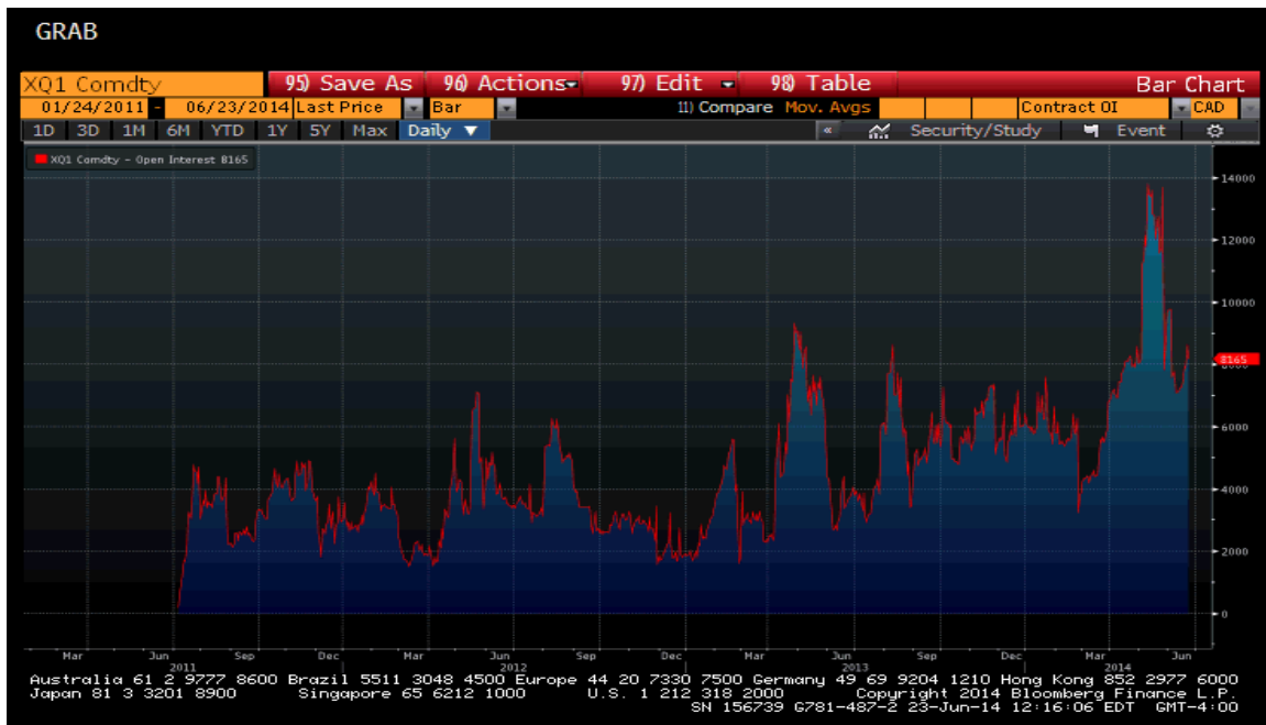
Figure 1 : Intérêt en cours du CGF de juin 2011 à juin 2014

Grâce au projet « Courbe de rendement », l'intérêt en cours du CGF a connu une croissance constante, passant de zéro (0) en juin 2011 à un sommet de près de 13 000 contrats en mai 2014. Cependant, depuis cette date, l'intérêt en cours du CGF a fléchi pour s'établir à environ 8 000 contrats, ce qui correspond au niveau de résistance historique pour ce contrat (voir la figure 1 ci-dessous).