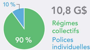
primes maladie 2021

Produits connexes : Assurance maladie complémentaire; assurance voyage; assurance maladies graves; assurance invalidité; assurance décès ou mutilation par accident; et comptes de crédits-santé.